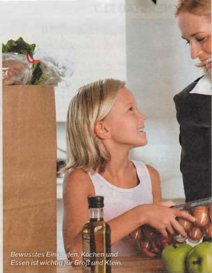
Bewusstes Einkaufen, Kochen und Essen ist wichtig für Groß und Klein.

Ü bergewicht ist bei Kindern und Jugendlichen ein Problem, das zunehmend an Bedeutung gewinnt. Überschüssige Kilos sind wie eine schwere Schultasche, die den Rücken belastet und unangenehm beim Laufen und Springen ist. Der große Unterschied besteht darin, dass man eine Schultasche einfach in eine Ecke stellen kann, überflüssige Kilos aber leider nicht.